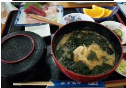
あんこうの「どぶ汁」定食(北茨城・大津港)

は南伊豆、松崎の先の妻良にあるお店「びやく」新鮮な伊豆の地魚の寿司と桜の葉が練りこまれていてほんのり桜の香りがする「桜そば」のセット。