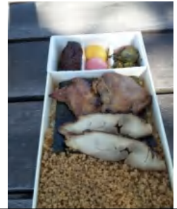
マイ定番「とりめし弁当」(群馬)