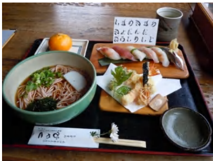
南伊豆の「びやく」の地魚寿司と桜そば